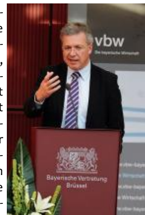
MdEP Markus Ferber spricht sich für die Einführung einer Finanztransaktionssteuer aus.

MdEP Ferber erinnerte in seiner Rede an die Beschlüsse der G 20-Staaten in Pittsburgh vom September 2009, nach denen kein Finanzinstitut und kein Finanzprodukt unreguliert bleiben soll, damit die Stabilität der Finanzmärkte und ein ausreichender Schutz der Investoren sichergestellt sei und sprach sich im Gegensatz zur vbw für die Einführung einer Finanztransaktionssteuer aus.