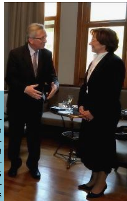
Die angeregte Diskussion im Anschluss

früheren Bundeskanzler Helmut Kohl und dem damaligen französischen Staatspräsident Jacques Chirac gefeiert, als auf seine Initiative eine Einigung über den Stabilitäts- und Wachstumspakt zur Wirtschafts- und Währungsunion gelang. Seit 2005 ist Jean-Claude Juncker erster ständiger Vorsitzender der Eurogruppe. Mit der Verleihung der Europamedaille würdigte Staatsministerin Emilia Müller die unermüdliche Arbeit und die Verdienste Jean-Claude Junckers.