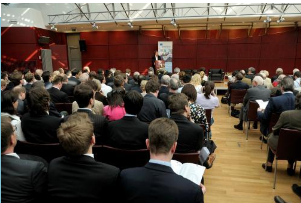
Europaministerin Emilia Müller eröffnet das Briefing des European Movement International in der Bayerischen Vertretung in Brüssel

werde besonders deutlich an den weltweit steigenden Rohstoffpreisen sowie an den hohen Defiziten und Schuldenständen der öffentlichen Haushalte, insbesondere auch in den USA. Als Irene nahm Cox auch zur finanziellen Situation Irlands Stellung. Das letztes Jahr geschnürte Rettungspaket sei unabdingbar. Es gebe Irland die notwendige Zeit, um Reformen umzusetzen und Irland damit in die Lage zu versetzen, sich wieder zu angemessenen Konditionen an den Finanzmärkten zu refinanzieren. Irland sei vor allem deshalb in finanzielle Schwierigkeiten geraten, weil die irischen Banken unterstützt werden mussten. Dies komme vor allem auch den britischen, französischen und deutschen Banken zugute, die in Irland in großem Umfang investiert sind. [Fortsetzung nächste Seite]