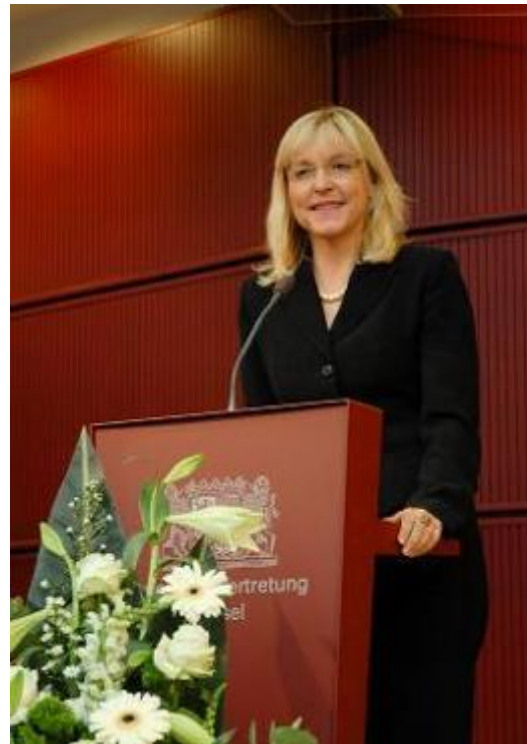
Bayerns Justizministerin Dr. Beate Merk

Staatsministerin Merk sagte in ihrer Rede, dass das Ziel der Europäischen Kommission, den freien Verkehr personenbezogener Daten im Binnenmarkt zu gewährleisten, zwar legitim erscheine, dass jedoch über personenbezogene Daten nicht in dem Maße frei verfügt werden könne, wie das bei Waren möglich sei. Ziel der neuen Datenschutzrichtlinie müsse es sein, den Einwilligungsvorbehalt und die Zweckbindung als tragende Grundprinzipien des Datenschutzes zu stärken. Merk betonte auch, dass gerade jüngeren Menschen ein Bewusstseinswandel beim Umgang mit ihren Daten zugestanden werden müsse, so dass für sie die Möglichkeit bestehe, die Löschung bestimmter Daten zu veranlassen. Ganz besonders wichtig sei im Interesse des Verbrauchers auch der Aspekt der Datensicherheit. Das Vertrau-