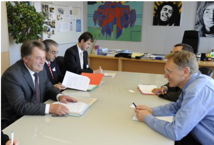
Landwirtschaftsminister Helmut Brunner in der Diskussion mit Kommissar Janez Potočnik

Am 25.05.2011 lud der Bayerische Staatsminister für Ernährung, Landwirtschaft und Forsten, Helmut Brunner zu einer Veranstaltung zum Thema „Die GAP bis 2013: Welcher Spielraum bleibt zukünftig für die ländliche Entwicklung?“ in die Bayerische Vertretung in Brüssel ein. Vor hochrangigen Vertretern der EU-Agrarpolitik stellte er die bayerischen Positionen zur Gemeinsamen Agrarpolitik (GAP) nach 2013 vor.