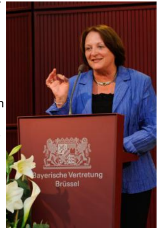
Bundesjustizministerin Sabine Leutheusser-Schnarrenberger