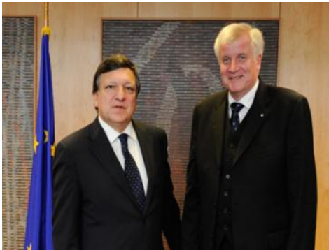
Kommissionspräsident Barroso und Ministerpräsident Seehofer