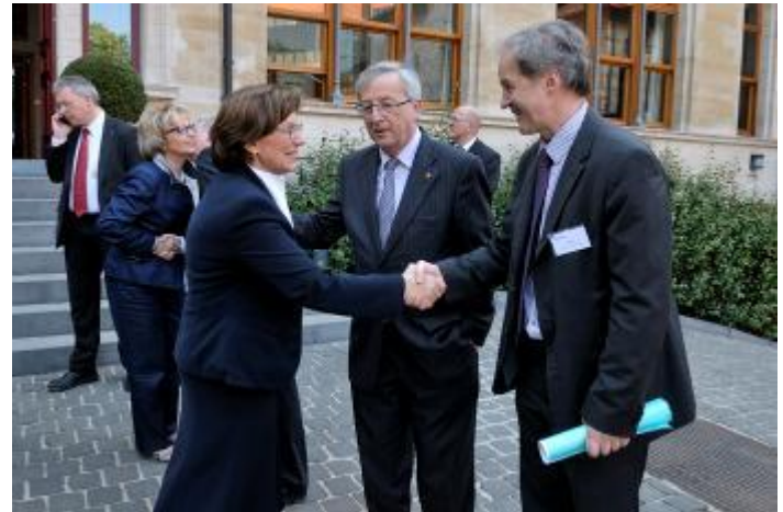
Emilia Müller begrüßt den luxemburgischen Premierminister und Präsidenten der Euro-Gruppe Jean-Claude Juncker, und dem Vorsitzenden des Umweltausschusses des Europäischen Parlaments, Jo Leinen

Im Vorfeld dieser Veranstaltung verlieh die Staatsministerin dem Politiker die Europamedaille des Freistaates Bayern, um die Verdienste Jean-Claude Junckers in einem vereinigten Europa zu würdigen.