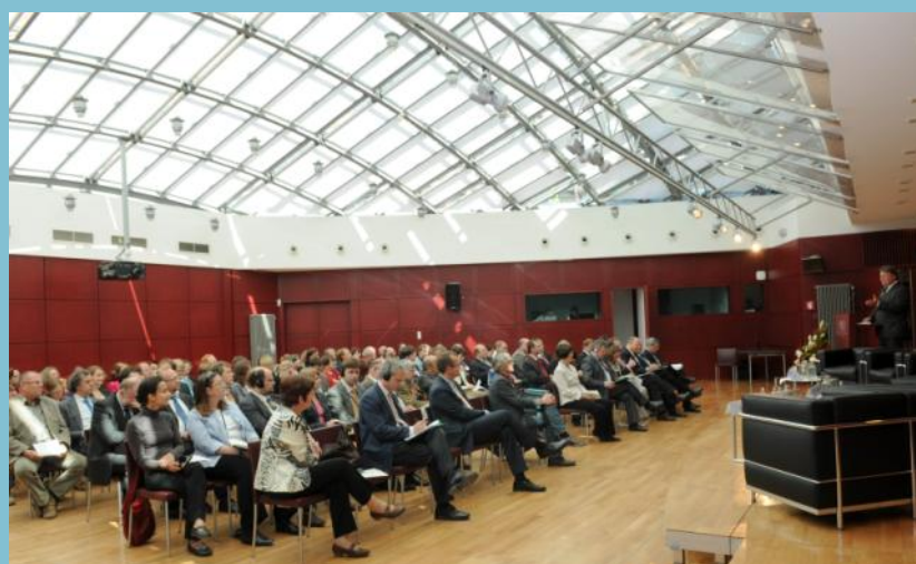
Staatsminister Brunner vor Brüsseler Fachpublikum

dass auch künftig freiwillige Maßnahmen vor rechtlichen Regelungen möglich sein müssten.