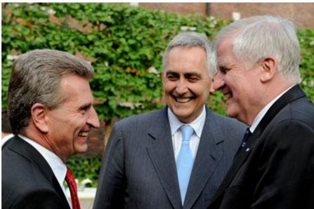
V.l.n.r.: Energiekommissar Oettinger, Siemens CEO Löscher und Ministerpräsident Seehofer

Ebenso hob er die konstruktive Rolle von Siemens bei der Bewahrung von industriellen und hochqualifizierten Arbeitsplätzen hervor. Siemens-Vorstandsvorsitzender Löscher verwies darauf, dass die Siemens AG seit über 160 Jahren für , Qualität, Zuverlässigkeit und Internationalität