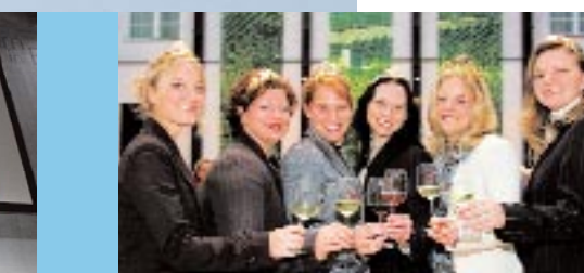
Fränkische Weinkönigin mit Weinprinzessinnen