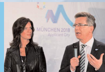
Olympia 2018 – Katharina Witt und Bundesminister Thomas de Maizière