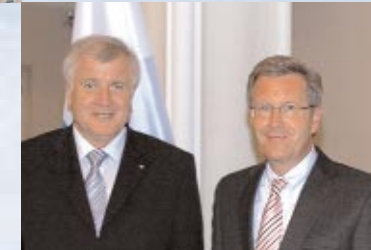
Ministerpräsident Seehofer und Bundespräsident Wulf

Jedes Jahr kommen rund 40.000 Besucher in die Vertretung.