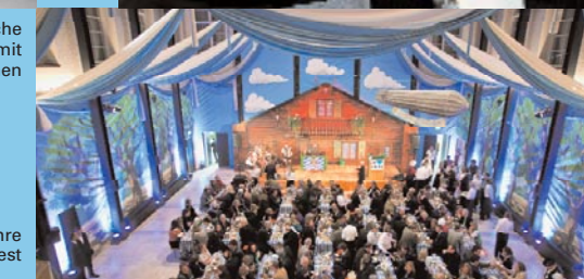
200 Jahre Oktoberfest