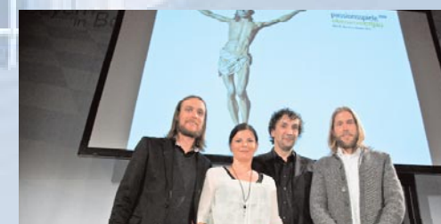
Präsentation Passionsspiele Oberammergau