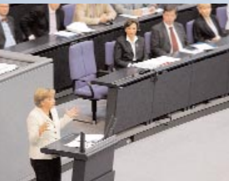
Emilia Müller im Bundestag