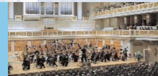
Neujahrskonzert im Konzerthaus am Gendarmenmarkt