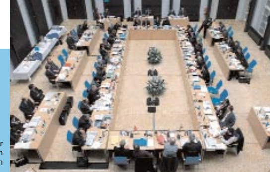
Konferenz der Ministerpräsidenten in der Halle Bayern