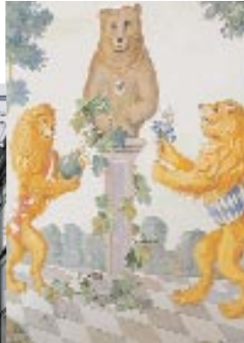
Bayerischer und fränkischer Löwe mit dem Berliner Bären