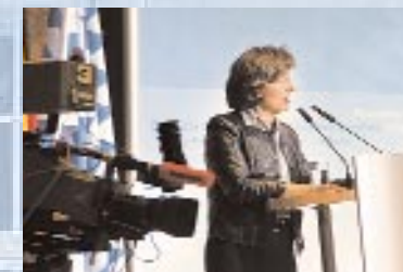
Emilia Müller bei einem Pressegespräch